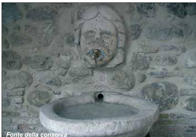
Fonte della conserva

Riapertura via della Conserva del capoluogo. ■