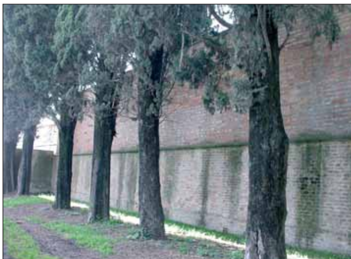
Il muro di cinta del cimitero

Il 16 giugno 1944 quattro innocenti lavoratori furono uccisi da elementi della Repubblica Sociale presso il muro di cinta del cimitero di Montorio.