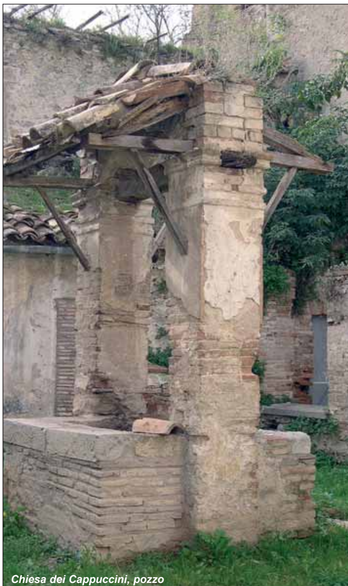
Chiesa dei Cappuccini, pozzo

La dismissione della discarica e una scuola per il recupero di reperti archeologici