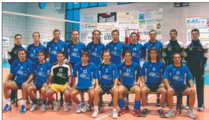
Montorio Volley - stagione 2004/2005