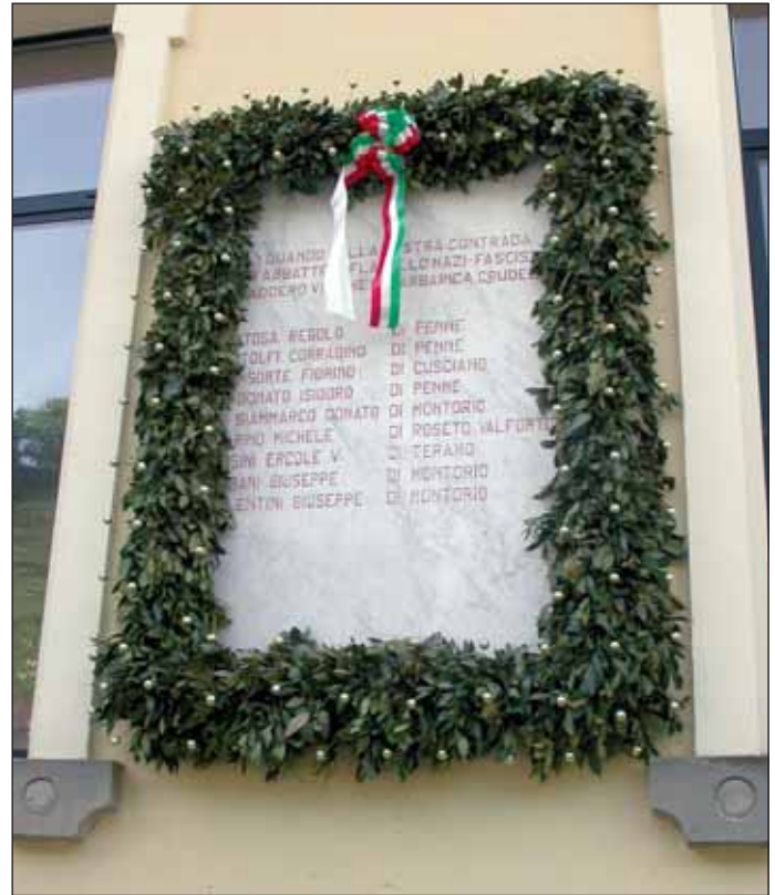
■ Lapide in memoria delle vittime sul muro dell'Istituto di ragioneria