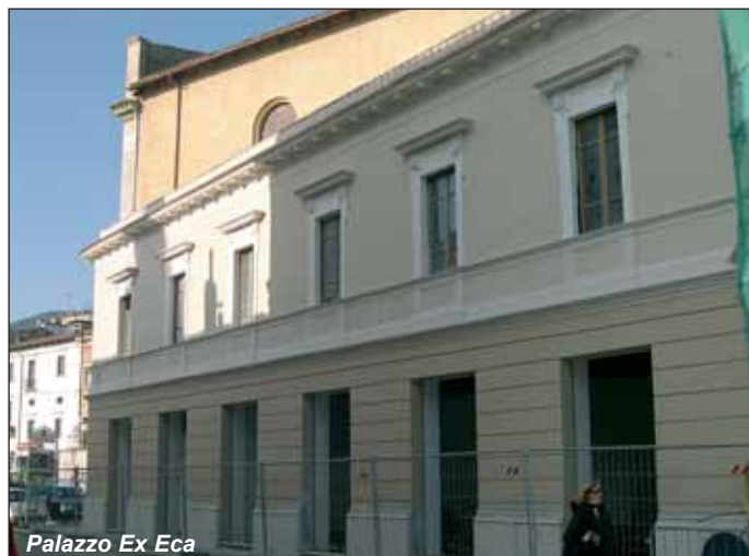
Palazzo Ex Eca

Adeguamento, recupero e valorizzazione delle infrastrutture del