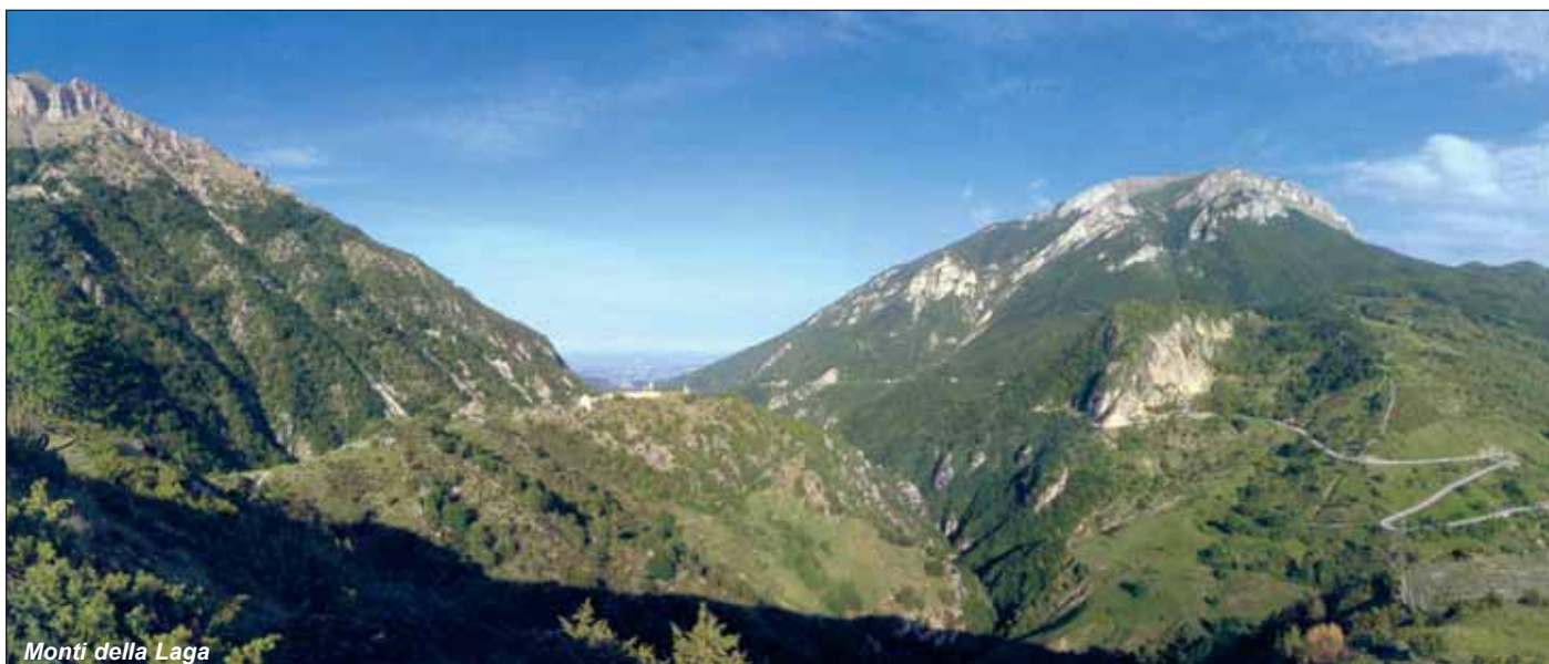
Monti della Laga

Le frazioni diventano dunque l'ossatura portante del sistema ricettivo a servizio dell'Area naturale ma anche dei futuri impianti termali. ■